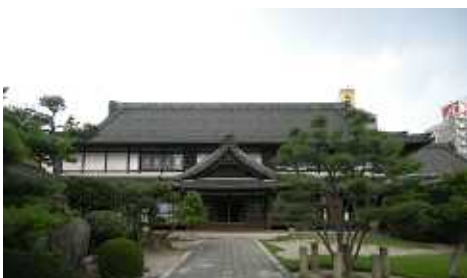
大正7年の建物の耐震補強工事です。