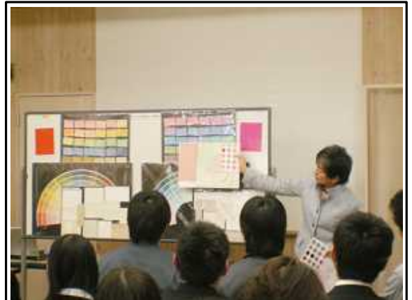
カラーコーディネート研修の様子